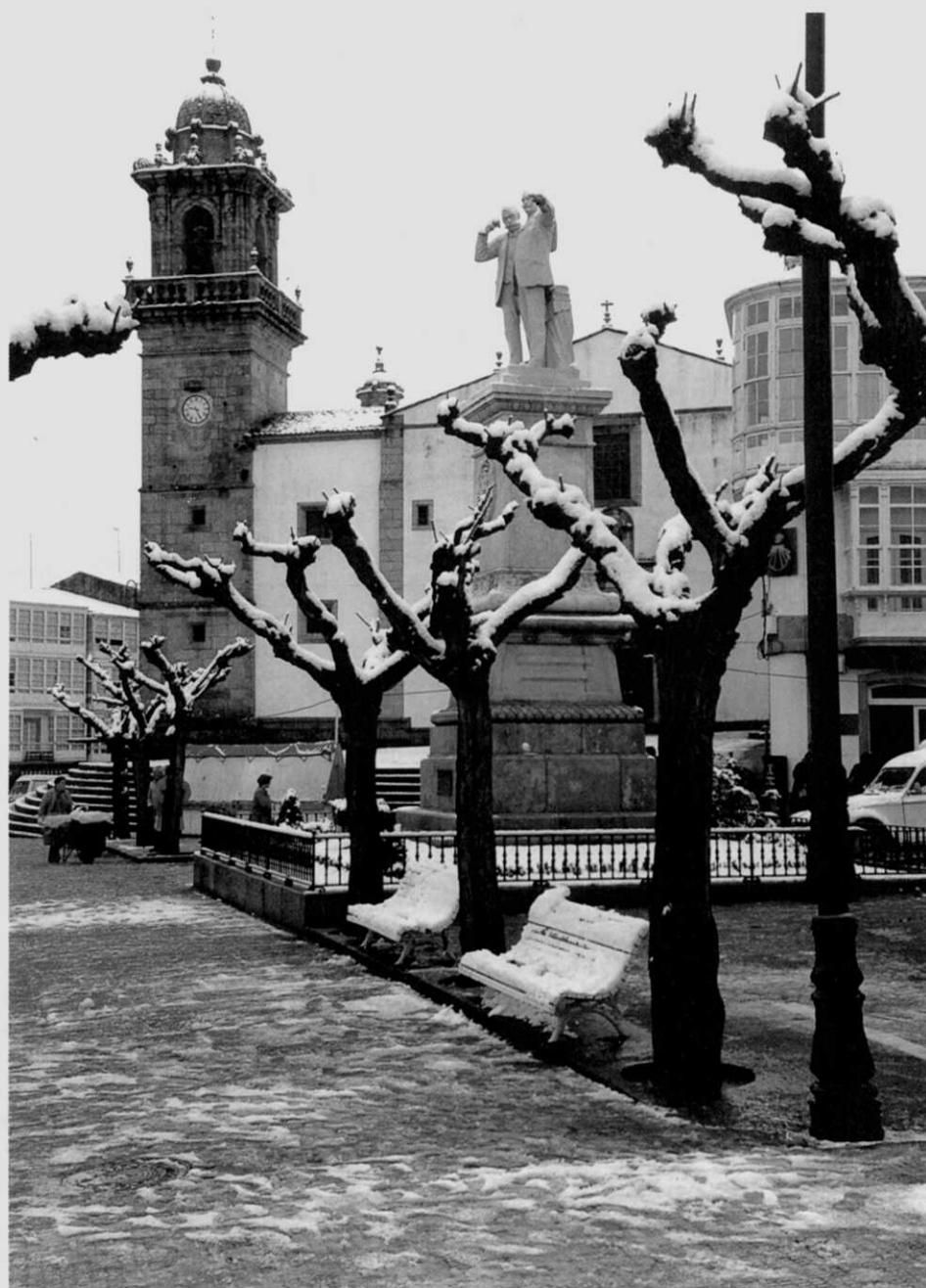
Unha imaxe pouco frecuente: Betanzos nevado (febreiro de 1993). Fotografía de José Luis Zamora.