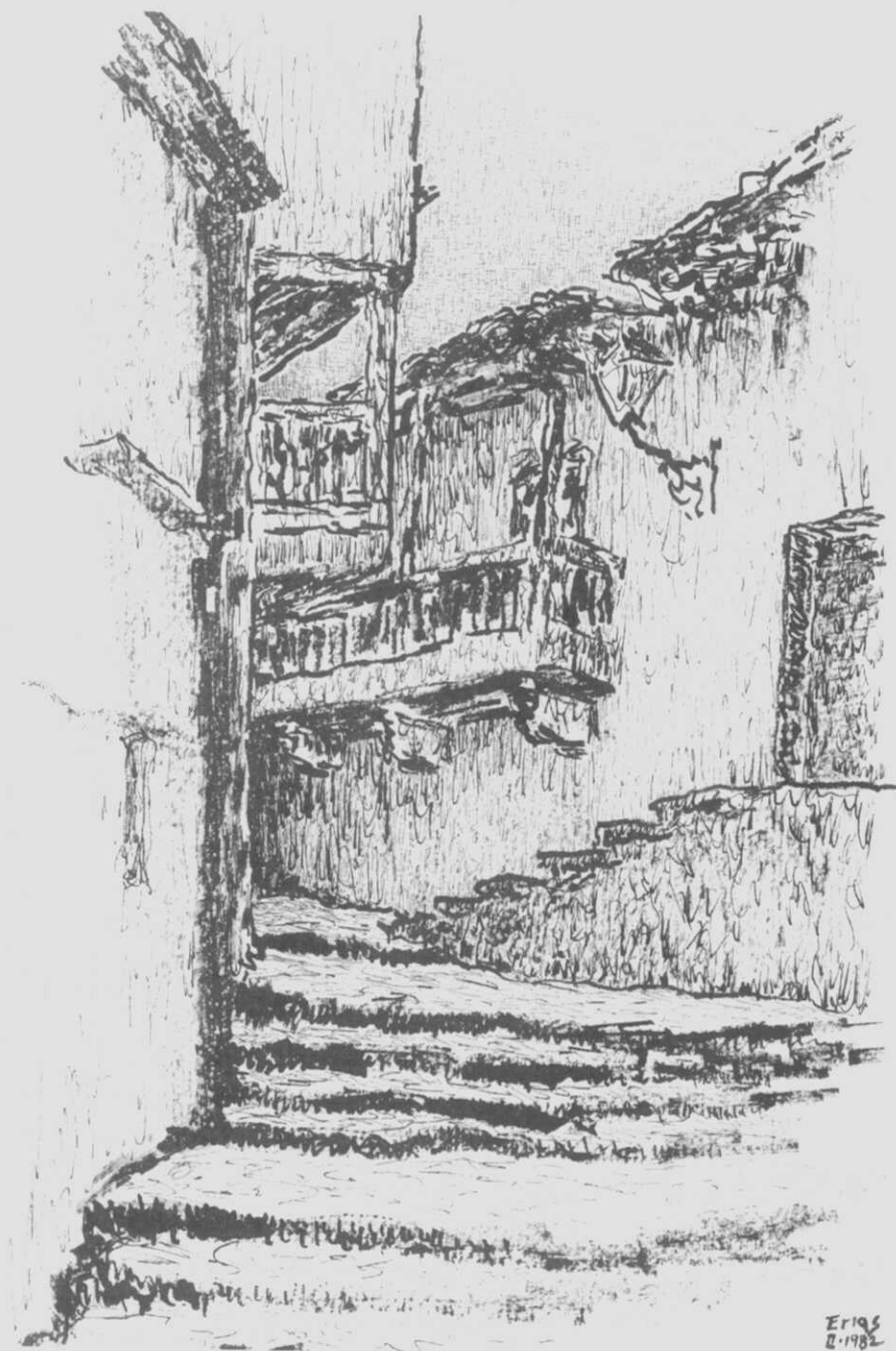
A vella entrada do Paseo das Almenas, perto da Porta da Vila de Betanzos. Debuxo: Erias.