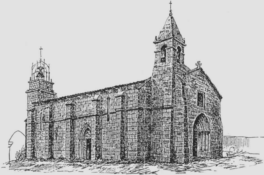
Fig. 1.- A igrexa de Santiago e a Torre do Reloxio a finais do s. XIX, segundo debuxo de Veiga Roel