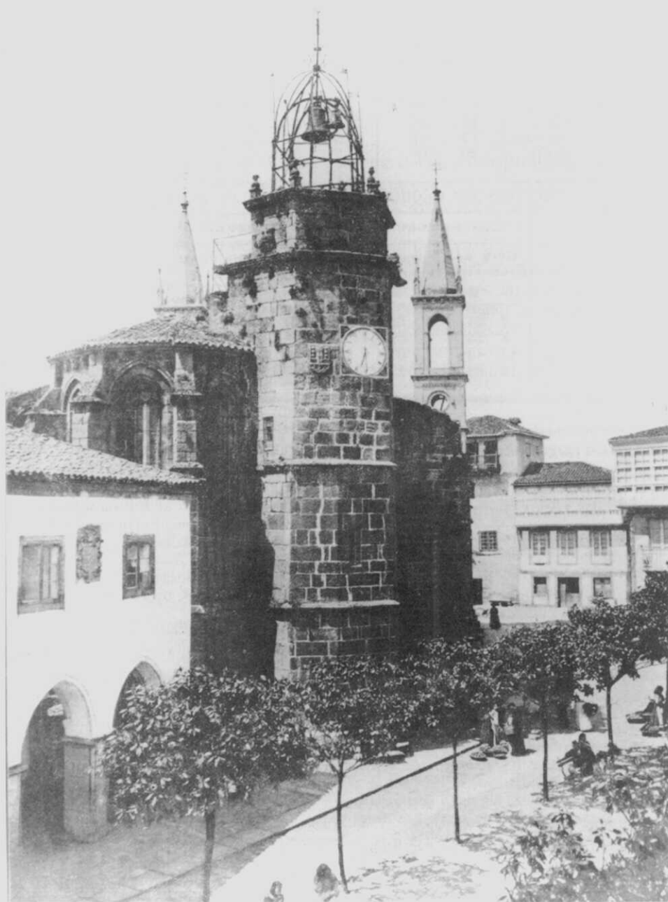
Fig. 4.- Fotografia da Torre do Reloxio e da igrexa de Santiago a principios deste século. Aínda non foran instaladas as campás e o relóxico doado por D. Manuel Naveira.